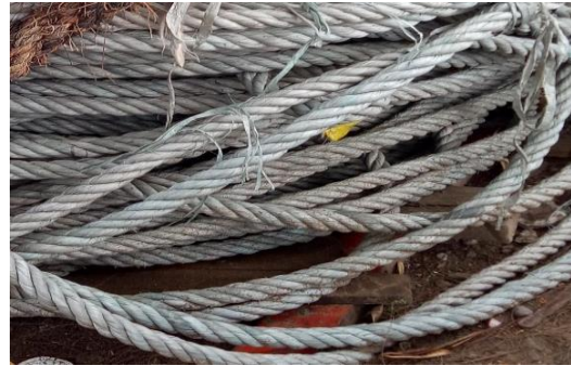
Gambar 5. tali pengikat kapal

Tali pengikat kapal pada rumpon berfungsi sebagai pengganti jangkar agar kapal tidak terbawa arus pada posisi standby sebelum melakukan operasi penangkapan ikan. Setelah kapal sampai pada fishing ground yaitu tempat rumpon berada. Maka kapal di ikat menggunakan tali pengikat kapal yang sudah terpasang pada rumpon. Biasanya pada ujung tali pengikat kapal diberi tandi seperti pelampung kecil agar memudahkan pada waktu pengambilan tali pengikat untuk diikat pada kapal. Tali pengikat kapal terbuat dari polyethylene (PE). Ukuran 18 mm dan Panjang 20 meter.