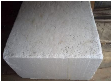
Gambar 1. pelampung rumpon

Rumpon laut dangkal yang digunakan di Gampong Jawa Kota Banda Aceh menggunakan styrofoam berbentuk empat persegi dengan Panjang 1 meter, lebar 1 meter dan tinggi 60 cm. jumlah pelampung 1 buah. Adapun syarat-syarat dalam pemilihan pelampung adalah: