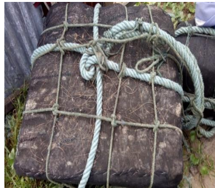
Gambar 3. tali pengikat pelampung

Setelah pelampung dibungkus dengan jaring merlin kemudian pelampung diikat menggunakan tali pembungkus pelampung. Tali pembungkus pelampung terbuat dari polyethylene (PE). Berukuran 10 mm dengan Panjang 30 meter.