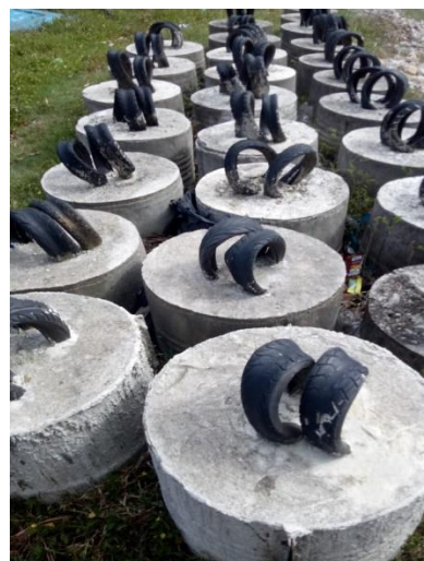
Gambar 6. Pemberat

Ketahanan pemberat ini sendiri mencapai 10 tahun dikarenakan tidak busuk dalam air. Pemberat yang digunakan berbentuk lingkaran. Material yang digunakan pada pemberat berupa ban bekas yang dipadukan dengan semen cor di dalam ban dengan berat 150kg. Diameter 50 cm dengan jumlah 6 buah pemberat yang digunakan untuk satu unit rumpon laut dangkal.