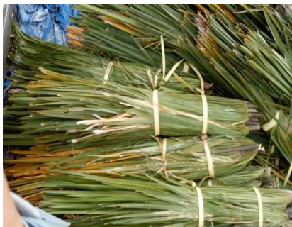
Gambar 4. atraktor (daun lontar)

Selain itu tipe daun kelapa membujur kurang melebar dalam perairan. Jumlah daun lontar dalam satu unit rumpon laut dangkal di Gampong Jawa berjumlah 30 lembar daun lontar yang di ikat pada rumpon berjumlah 6 ikat (satu ikat berjumlah 5 lembar daun lontar). Ukuran daun lontar Panjang 1,5 meter dan lebar 2 meter dengan jarak daun lontar dengan daun lontar 1 meter.