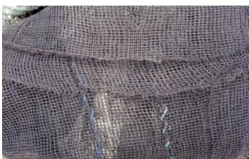
Gambar 2. jaring marlin

Jaring merlin ini digunakan untuk membungkus pelampung rumpon laut dangkal yang digunakan oleh nelayan di Gampong Jawa Kota banda aceh. Jaring merlin terbuat dari bahan rafia dengan ukuran Panjang 30 meter dan lebar 1 meter ukuran lobang jarring merlin 5/8 mili dengan ketahanan mencapai 5 tahun.