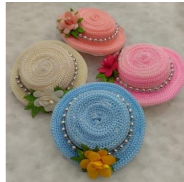
Gambar 2. Bross dari olahan Sampah Plastik

Produksi yang paling rendah adalah bunga hiasan (13%), hal ini disebabkan karena rendahnya permintaan konsumen. Menurut ketua PKK Gampong Peurada, hal ini dipengaruhi oleh tingginya penjualan bunga hias yang diproduksi oleh pabrik-pabrik besar lebih menarik dan dijual dengan harga yang terjangkau. Sebaliknya, produksi olahan sampah plastik yang paling banyak adalah gantungan kunci dan bross (38%). Hal ini disebabkan karena tingginya permintaan oleh konsumen. Pembuatan bross dan gantungan kunci tergolong mudah dan tidak banyak menyita waktu. Sehingga dapat diproduksi dalam jumlah yang besar. Umumnya bross dan gantungan kunci ini dipesan untuk souvenir resepsi pernikahan.